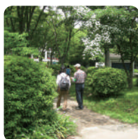
森の恵みクラフト& 木のふしぎ探検