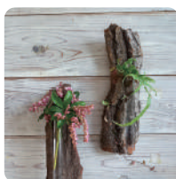
木の一輪挿しに 草花を生けよう (フラワーセラピー体験)