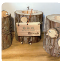
「アサヒの森」の ヒノキ間伐材を使って 「植木鉢」を作る体験