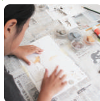
土のパステル 「Dopas (ドパス)」 でお絵描きしよう！

自然観察や木工クラフトなどの体験プログラムから、農山村の特産品の販売など、多彩なプログラムが満載！※プログラムは変更になる場合がございます。