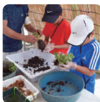
こけ玉作り・ 木への漢字パズル